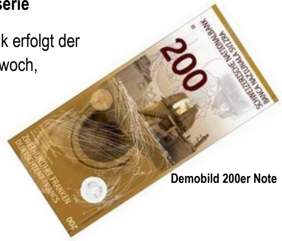
Demobild 200er Note

Gemäss Schreiben der Schweizerischen Nationalbank erfolgt der Ausgabetermin der neuen 200-Franken-Note am Mittwoch, 22. August 2018.